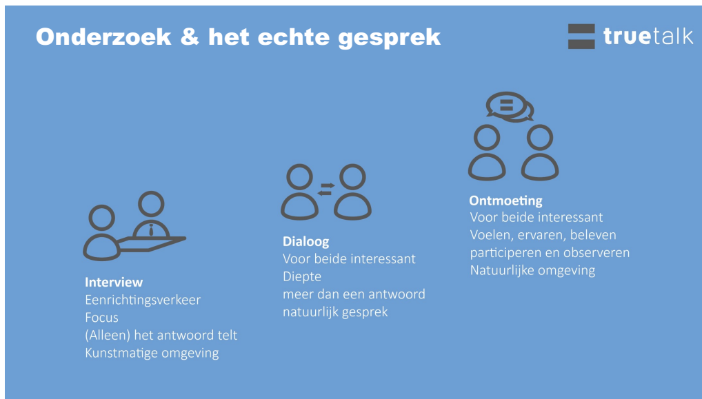
Figuur 1: Verschillen tussen interview en dialoog

Een diverse groep gesprekspartners betekent ruimte voor uiteenlopende verhalen en ervaringen. TrueTalk koos daarom voor de open dialoogvorm in plaats van strakke interviews. In een dialoogvorm kan iedereen die iets wil zeggen over het onderwerp namelijk daadwerkelijk zeggen wat hij of zij kwijt wil. Zo kan men tot een echt en natuurlijk gesprek te komen en het echte verhaal horen. Daarnaast geeft een dialoog de mogelijkheid om door te vragen op wat gesprekspartners vertellen en de diepte in te gaan. Bij interviews is de vragenlijst leidend en is er geen tot weinig ruimte om mee te kunnen bewegen met onderwerpen die voor de gesprekspartners belangrijk zijn.